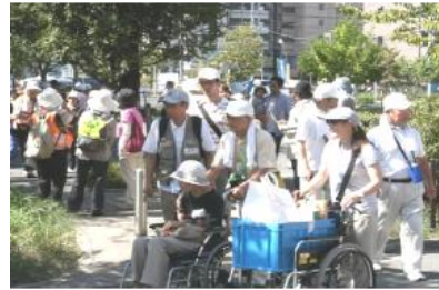
災害時要支援者の方のサポート 体験(昨年の様子)