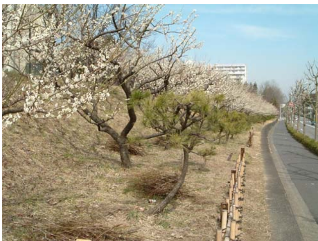
＜東永山複合施設東側法面の梅林＞